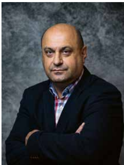
Tomislav Grahovac Predsjednik Hrvatskog rukometnog saveza