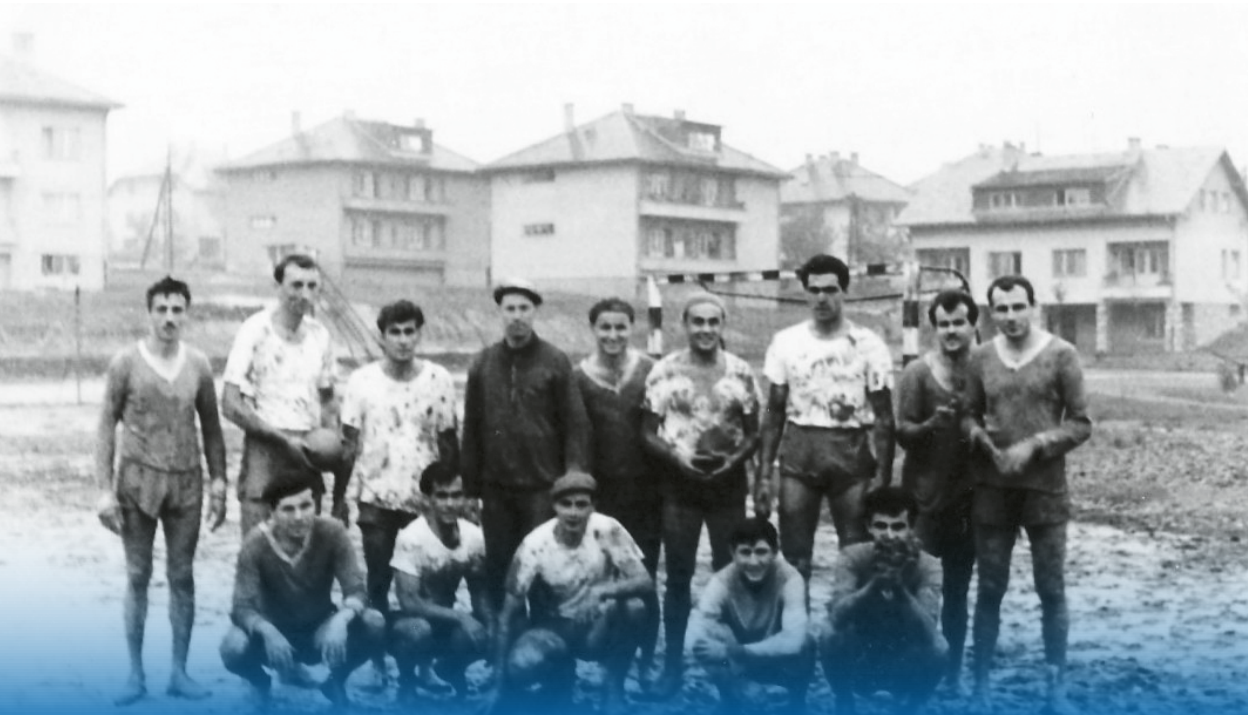
Na igralištu na Švarči 1960. - utakmica Turbine i Korane (preteča Dubovca) u malom rukometu