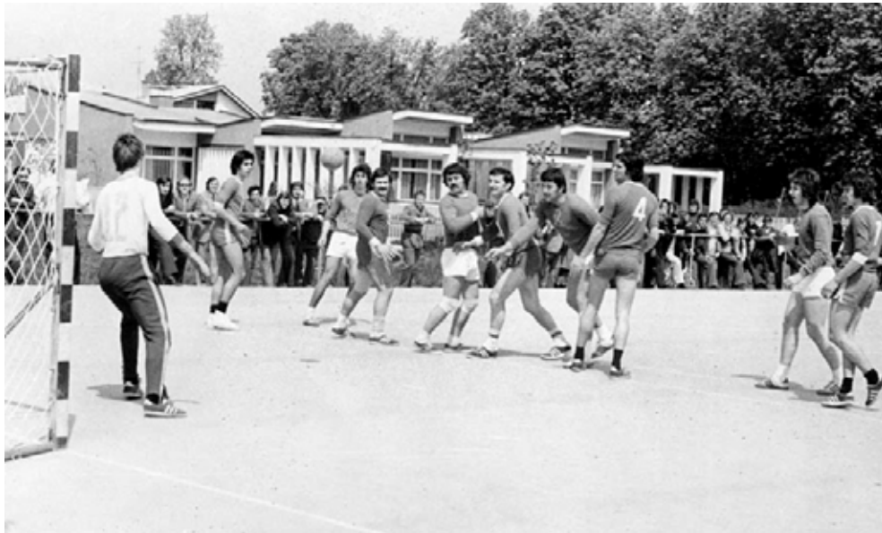
Dubovac - kolijevka malog rukometa u Karlovcu - Bastijančićevo polje

Važan korak za organizaciju rukometa bilo je osnivanje Rukometnog