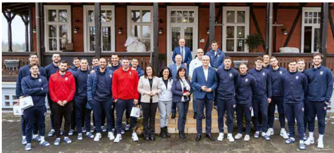
Rukometna reprezentacija u posljednje vrijeme čest je gost u Karlovcu. Na slici s karlovačkim gradonačelnikom za vrijeme priprema prije početka Svjetskog prvenstva

Za grad koji živi rukomet, nema veće časti nego ugostiti vlastitu nacionalnu momčad. Svako gostovanje hrvatske rukometne reprezentacije u Karlovcu bilo je više od obične utakmice – bio je to praznik sporta, potvrda dugogodišnje tradicije i susret s igračima koje su Karlovčani uvijek dočekivali s posebnim ponosom.