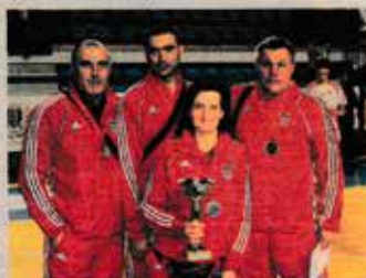
Stručni stožer reprezentacije