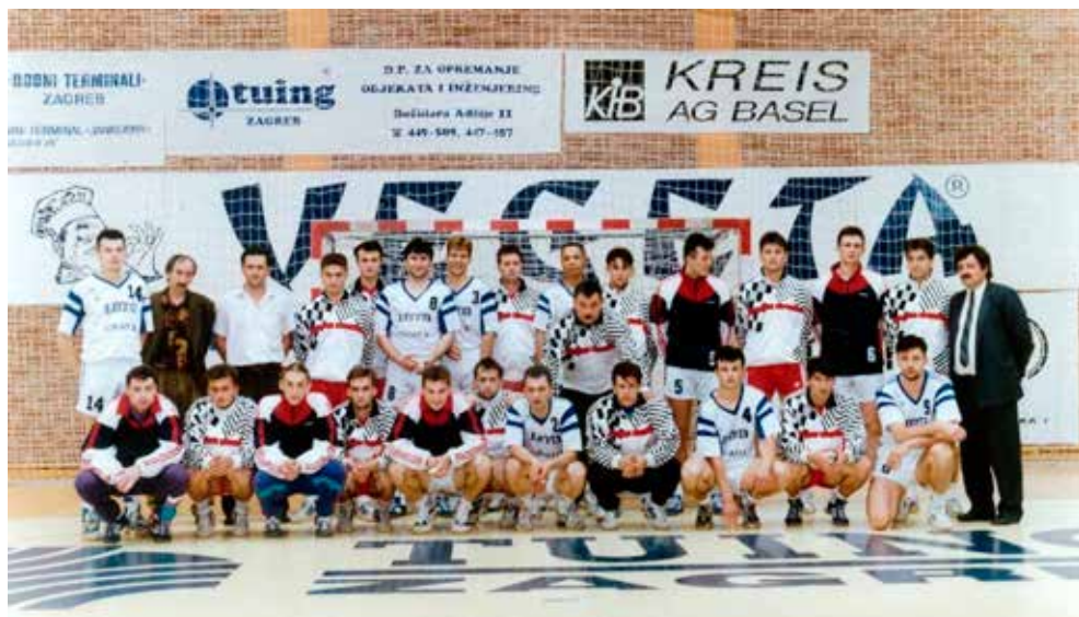
Polufinale kupa Zagreb Loto - Karlovačka pivovara, 1992.