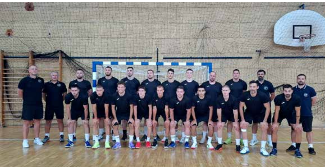
Prvoligaška seniorska momčad HRK Karlovca, sezona 2025./26.